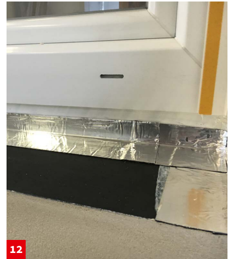
12 Aufkleben des akurit VARIO FBS DB Dichtband