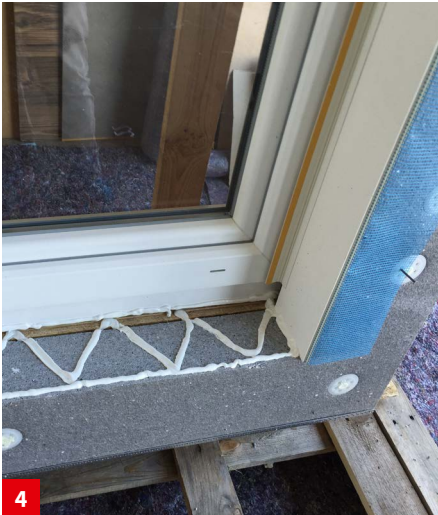
Auftragen des akurit VARIO MK Montagekleber