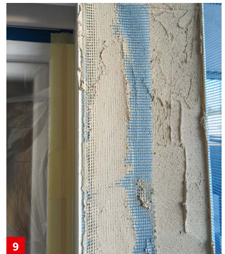
Auftragen der Armierungslage