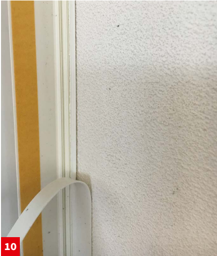
10 Abziehen der Schutzlasche des Fensteranschlussprofils