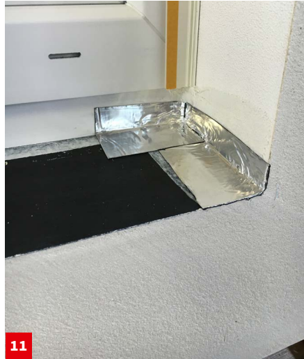
11 Aufkleben der akurit VARIO FBS DE Dichtecken