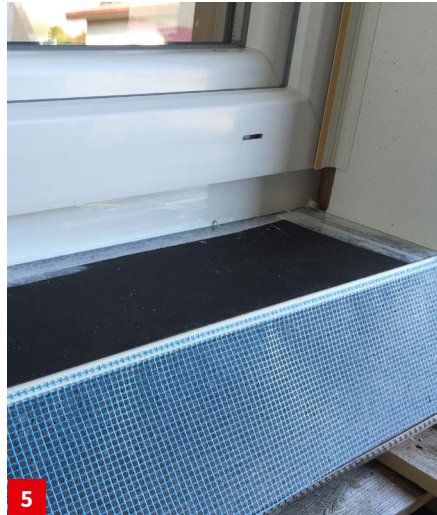
Einkleben der VARIO Keilplatte