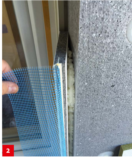
Montage VARIO Laibungselement