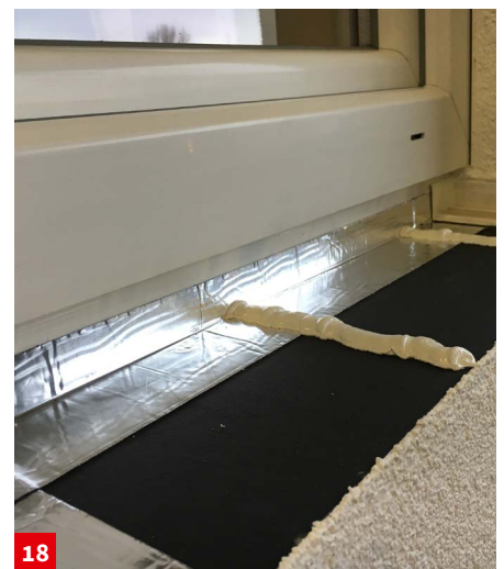
18 Auftragen der Klebestränge mit akurit VARIO MK im Abstand von max. 300 mm