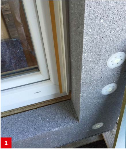
Montage VARIO Fensteranschlussprofil