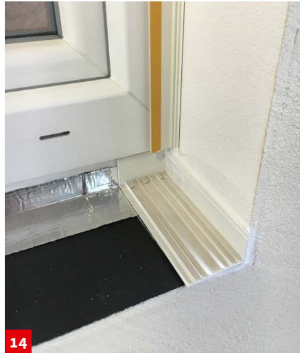
14 Aufkleben akurit VARIO FBG Fensterbank Gleitabschluss