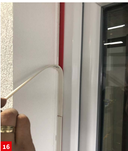
16 Schutzfolienentfernung und ggfls Aktivierung des Fensteranschlussprofils