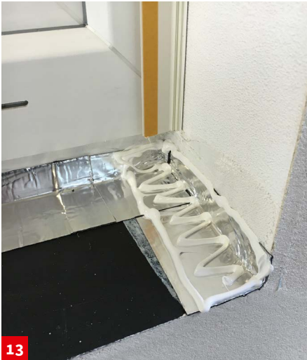
13 Auftragen des akurit VARIO MK Montagekleber