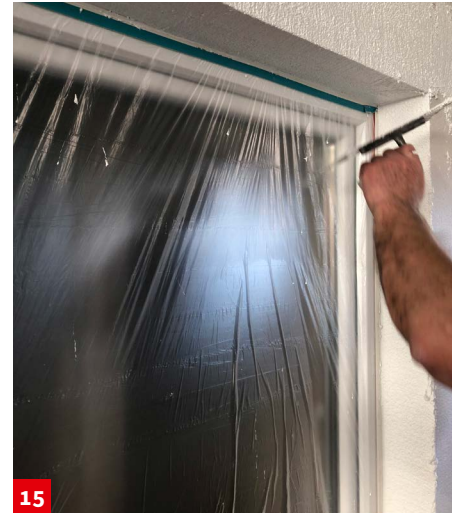
15 Auftragen des Oberputzes