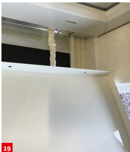
Einkleben akurit VARIO FB Fensterbank