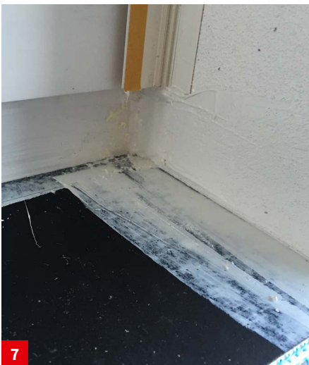
Verschließen und Abspachteln des Gewerke Loch mit akurit VARIO MK Montagekleber