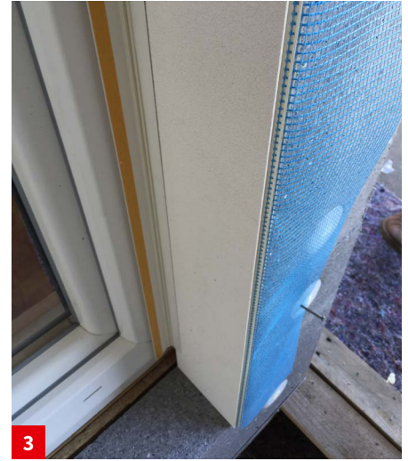
Montage VARIO Laibungselement